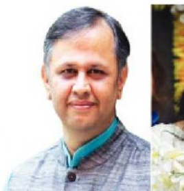
વિદ્યાર્થીઓ આત્મનિર્ભર બને એ માટે શિક્ષણની સાથે સ્ટાર્ટઅપ એન્ડ ઈનોવેશનને રાજ્યના શિક્ષણમંત્રી જીતભાઈ વાઘાણીએ પ્રાધાન્ય સાકાર કરશે. આ સેમિનારમાં આપ્યું છે.સૌરાષ્ટ્ર યુનિવર્સિટીના ભારતીય પેટન્ટ ઓફીસનાં કંટ્રોલર